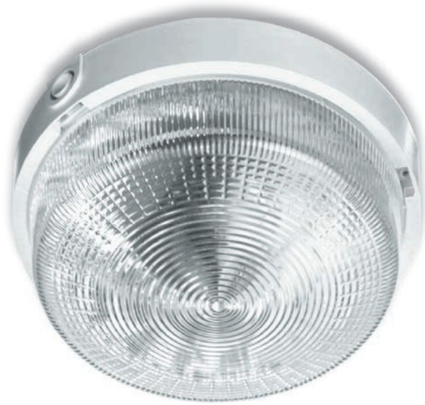
RONDO 1x100W OPAL